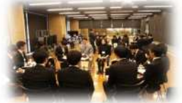
フリートークの様子

内 容 全体説明(山梨県の組織や試験制度について) 11:00～11:50 業務説明、職員とのフリートーク、職場見学等 12:50～16:30